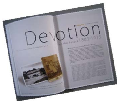
記念誌『Gift for the Future: 未来に贈る125年』が大学博物館から刊行されました。