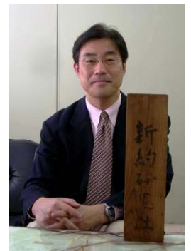
蛭沼先生が使っておられた「新約研究社」看板