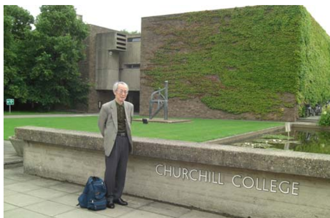
ケンブリッジ大学チャーチル・カレッジにて - 2012 年 7 月 9 日 -