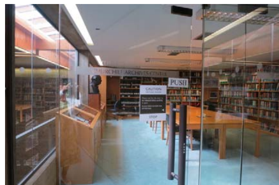
チャーチル・アーカイブ・センター入口